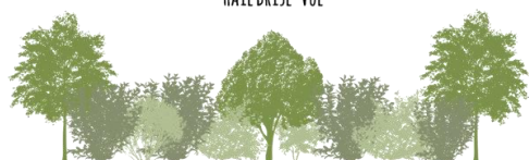
Un grand nombre de persistants